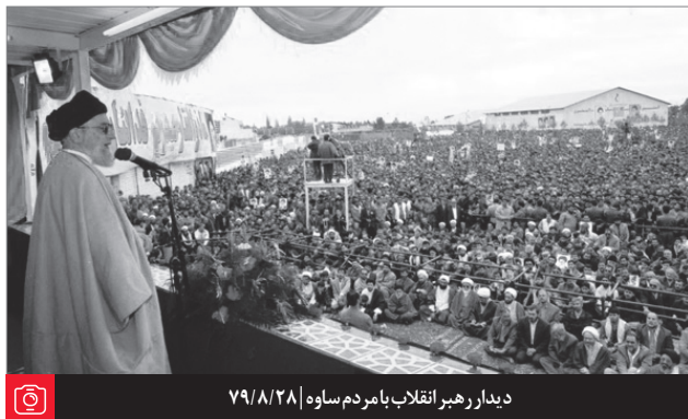
دیدار رهبر انقلاب با مردم ساوه ۷۹/۸/۲۸

باشیم برای ضربه‌هایی که به ما ممکن است - خدای ناخواسته - واقع بشود، چه از ناحیه‌ی این قشرهای داخلی که منافع غیر مشروع‌شان از دست‌شان رفته است، و آن ظلم‌هایی که به توده‌های محروم کرده‌اند الان نمی‌توانند بکنند، و می‌خواهند که اعاده بشود. و چه از خارج؛ آن کسانی که، این