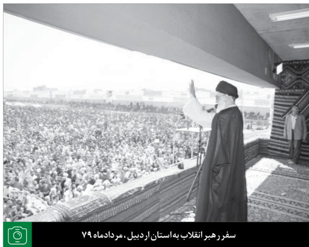
سفر رهبر انقلاب به استان اردبیل، مردادماه ۷۹

قرار بدهند، وابسته کنند. نگذارند این وابستگی از بین برود. و شما دانشجویهای عزیز خودتان در صدد این باشید که از غرزدگی بیرون بیایید. این گمشده‌ی خودتان را پیدا کنید. گمشده‌ی شما خودتان هستید. شرق خودش را گم کرده و شرق باید خودش را پیدا بکند. آنها در صددند که با هر