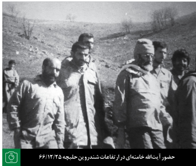
حضور آیت‌الله خامنه‌ای در ارتفاعات شندروین حلبچه ۶۶/۱۲/۲۵

مارک دوبوویتز، کارشناس اندیشکده‌ی ضدایرانی بنیاد دفاع از دموکراسی‌ها می‌نویسد: "راهبرد ترامپ برای خنثی‌سازی و کاهش نفوذ ایران در منطقه، محدود به لفاظی‌های گوش‌خراش است." روزنامه‌ی واشنگتن پست نیز در این باره نوشت: "حملات جمعه‌شب، به اندازه‌ی کافی قوی نبود تا مایه‌ی خجالت نشود، در نتیجه، بیش از آنکه به رژیم اسد لطمه وارد کند، به اعتبار آمریکا در صحنه بین‌المللی آسیب وارد کرد... حمله‌ی تحت رهبری آمریکا، حتی یک هواپیما، پایگاه هوایی یا سیستم تحویل را هدف قرار نداد و سوریه را با قابلیت‌های تسلیحات شیمیایی رها کرد." واشنگتن پست ادامه می‌دهد: "سوریه‌ی می‌داند که پیروز این حمله بودند به طوری که در خیابان‌های دمشق، جشن و شادمانی برپا بود، زیرا طرفداران دولت فهمیدند که حمله‌ی پرهزینه‌ی محقق نشده است." روزنامه‌ی گاردین نیز با انتقاد از حمله‌ی اخیر آمریکا به سوریه می‌نویسد: "این حمله، سوریه را قوی‌تر می‌کند و سوریه می‌تواند ادعا کند استوار ایستاد و مقابله کرد. تمامش عبث بود." ●