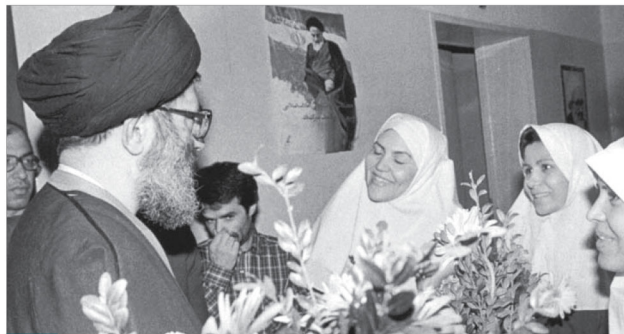
بازدید از بیمارستان بقیة الله (ع) ۶/۲/۹۵ مناسبت سوم بهمن، ولادت حضرت زینب (ع) و روز پرستار