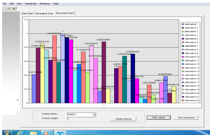
نمودار ۴: اولویت‌بندی عوامل براساس ماتریس تصمیم‌گیری روش FTOPSISIS