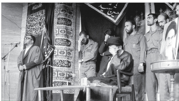
عزاداری در حضور آیت‌الله خامنه‌ای، محرم سال ۱۳۶۸