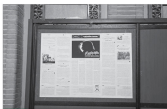
مکتب الزهرا تهران