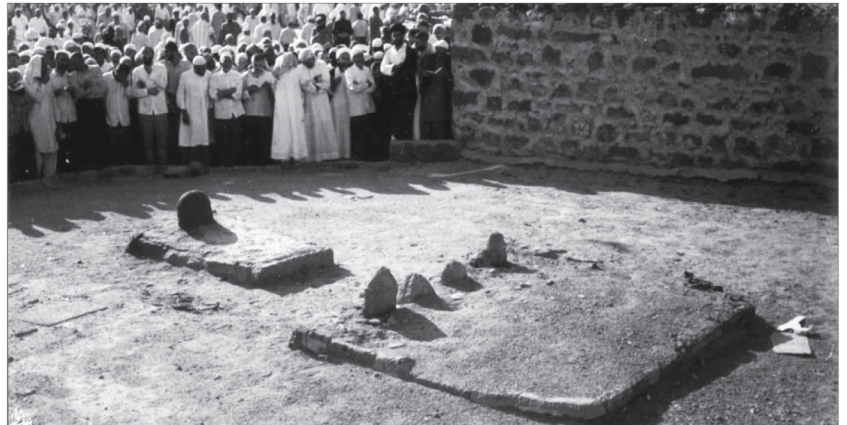
۹۹ پس مبارزه‌ی فرهنگی فقط نشستن و از احکام اسلام چیزهایی را بیان کردن بدون جهت‌گیری انقلابی و مبارزی نیست...

کارهایی که اجری وافر پیش خداوند و جایگاهی بی‌بدیل برای نظام اسلامی دارد: «اینجور کارهای بی‌سروصدا و خاموش و خالصانه، نه فقط برای شما پیش خدای متعال درجه و مرتبه درست می‌کند، بلکه در کل بنای جمهوری اسلامی اثر می‌گذارد، مثل سیمانی است که در یک بنایی تزریق کنند و آنرا مستحکم کنند. بانجام اینجور کارهای مخلصانه، بنای جمهوری اسلامی مستحکم می‌شود.» ● ۱۳۹۱/۰۳/۲۶