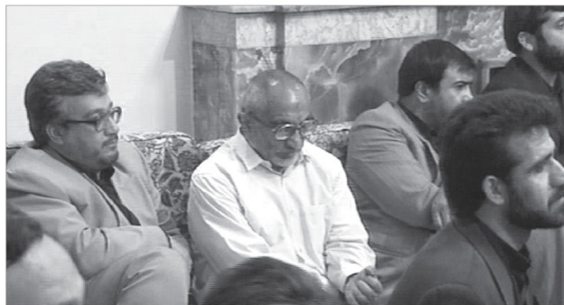
آخرین دیدار شهید لاجوردی با رهبر انقلاب قبل از شهادت | ۷۷/۲/۱۴

خط حزب: شما هم می‌توانید اقدامات آتش به اختیار خود را برای انتشار در نشریه برای ما ارسال کنید.