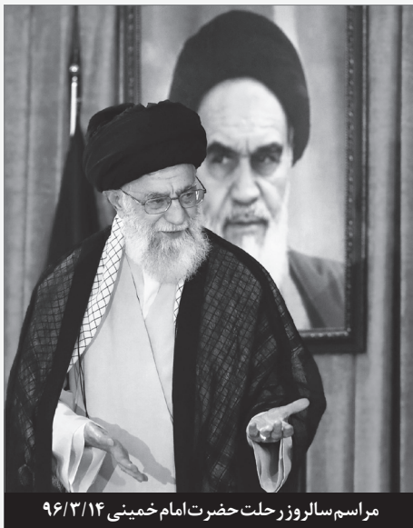
مراسم سالروز رحلت حضرت امام خمینی ۹۶/۳/۱۴