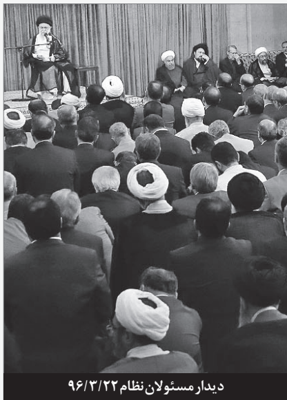
دیدار مسئولان نظام ۹۶/۳/۲۲

هفته‌نامه خبری-تبیینی نمازهای جمعه، مساجد و هیئت‌های مذهبی | سال دوم، شماره ۸۸ | هفته دوم تیر ۹۶