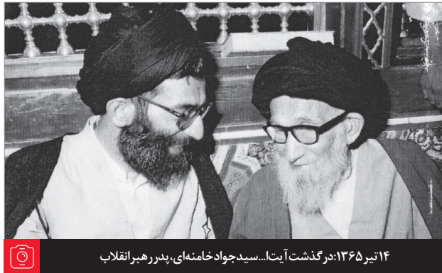
۱۴ تیر ۱۳۶۵: در گذشت آیت‌الله سید جواد خامنه‌ای، پدر رهبر انقلاب

یک روایت از امیرالمؤمنین نقل شده که در روزی که با آن حضرت مردم بیعت کردند... امیرالمؤمنین با صدای بلند به مردم فرمودند: «يٰۤاَيُّهَا النَّاسُ اِنَّ هٰذَا اَمْرٌ كُمْ لَيْسَ لِاٰخِذٍ فِيْهِ حَقٌّ اِلَّا مَنْ اَمَرْتُمْ» (۱) یعنی ای مردم این مسئله شماسست، کاری است متعلق به شما مردم و هیچ کس حقی در این کار، یعنی در خلافت و حکومت ندارد، «اِلَّا مَنْ اَمَرْتُمْ»؛ مگر کسی که شما او را امارت بدهید و حاکمیت بدهید. ملاحظه میکنید که امیرالمؤمنین نه در مقام احتجاج با دشمن، نه در مقام مباحثه و مجادله و اخذ به حجت خصم، بلکه با مردم خودش، با همان کسانی که او را قبول دارند، با او بیعت کردند، از او تقاضا کردند که همه چیز را میتواند با آنها صریحاً در میان بگذارد، به آنها میگوید که هیچ کس حق ندارد، مگر آن کسی که شما او را امارت دادید... مذاق اسلام این است که آنجائی که نصب الهی نیست یا نصب الهی معمول به نیست و عمل به آن نشده، آنجا یک راه بیشتر وجود ندارد و آن انتخاب مردم است. ۶۶/۴/۱۲ (۱) بحار الأنوار، ج ۳۲، ص ۸.