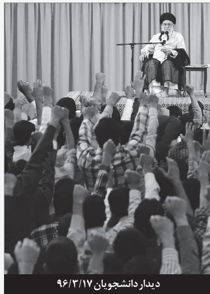
دیدار دانشجویان ۹۶/۳/۱۷

تصریح می‌کنند «مدیریت انقلاب، غیر از مدیریت اجرایی کشور است. برای رهبری، وارد شدن در میدان اولاً به صورت طرح مسأله و بسیج افکار عمومی است؛ ثانیاً به صورت خواستن از دستگاه‌های اجرایی است.» ۸۲/۰۲/۲۲