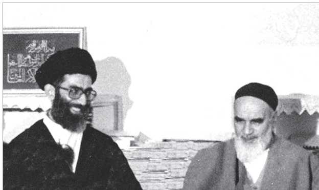
آیتا... خامنه‌ای در کنار امام خمینی | انتشار بمناسبت رحلت جانشین معمار کبیر انقلاب اسلامی

□ باسلام و خسته نباشید. ممنون و سپاس بخاطر مطالب مفیدتان که راهگشا و پاسخگوی بسیاری از سوالات ذهنی این حقیر میباشد و سپاس بخاطر مطلب جدیدتان که حدیث درس خارج حضرت آقا رو گذاشتید همیشه منتظر چنین مطلبی بودم چون ایشان حتما احادیث مستند و جالب و کاربردی برای این زمان را مطرح میکنند ابتدای درشان. خانواده ایرانی هم بسیار جالب است من همیشه از مطالب شما برای آموزش خودم ابتدا و بعد برای سرگروه‌های بسیج استفاده میکنم. اجر کم عندا... ●