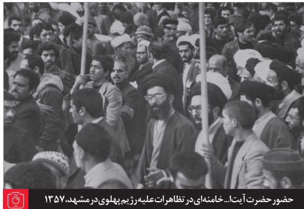
حضور حضرت آیت‌آ... خامنه‌ای در تظاهرات علیه رژیم پهلوی در مشهد، ۱۳۵۷

○ س: لطفاً غیبت را با توجه به مسائل ذیل بیان فرمایید: ۱- اگر بین دو نفر مسأله معلومی درباره مورد محسَنات یک نفر باشد. ۲- اگر گفتگو در مورد محسَنات یک نفر باشد. ۳- اگر والدین برای تربیت صحیح فرزندان خود رفتار یکی از آشنایان را تقدمی کنند. ج: بطور کلی اگر پشت سر مؤمن، مطلبی گفته شود که حقیقت دارد لکن اگر او مطلع شود ناراحت می‌شود و این مطلب به قصد تنقیص (۱) گفته می‌شود یا نزد عرف تنقیص به حساب می‌آید، غیبت است و جایز نیست و صرف تربیت فرزند مجوز غیبت نیست ولی گفتگو درباره خوبیهای یک فرد حکم غیبت را ندارد، همچنین در مورد مشاوره نیز اطلاع دادن ممانعی ندارد. ● عیب‌جویی