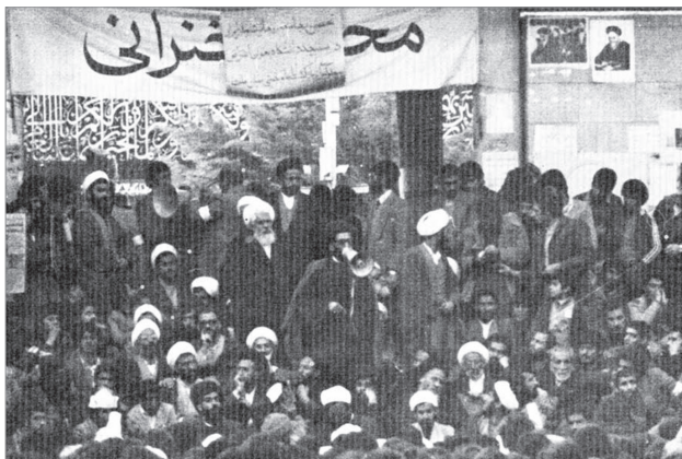
تحصن جمعی از روحانیون انقلابی در اعتراض به بسته شدن فرودگاه‌ها ۸/۱۱/۵۷

س: برادر من معتاد به مواد مخدر است و قاچاقچی مواد مخدر نیز هست، آیا بر من واجب است او را به مقامات رسمی مربوطه معرفی کنم تا از کار او جلوگیری کنند؟ ج: بر شما نهی از منکر واجب است و باید او را در ترک اعتیاد یاری کنید و همچنین او را از قاچاق و فروش و توزیع مواد مخدر منع نمایید و اگر اعلام وضعیت او به مقامات مربوطه، به او در این باره کمک کرده یا مقدمه نهی از منکر محسوب شود واجب است اعلام نمایید. ●