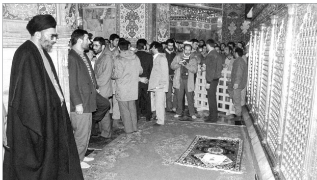
انتشار تصویر کمتر دیده شده از حضور رهبر انقلاب در حرم کربمه اهل بیت حضرت فاطمه معصومه (س) به مناسبت سالروز وفات ایشان

○ س: مراد از فک پائین که باقی گذاشتن موهای آن واجب است چیست؟ آیا شامل گونه‌ها هم می‌شود؟ ج: معیار این است که از نظر عرف، گذاشتن ریش صدق کند. س: ریش از نظر کوتاهی و بلندی باید چه مقدار باشد؟ ج: حد معینی ندارد، بلکه معیار این است که عرفاً بر آن ریش صدق کند و بلندبودن آن بیشتر از قبضه دست کراحت دارد. س: بلند کردن سیبیل و کوتاه کردن ریش چه حکمی دارد؟ ج: این کار فی‌نفسه اشکال ندارد. س: آیا تراشیدن ریش فسق محسوب می‌شود؟ ج: تراشیدن ریش بنا بر احتیاط حرام است و احوط این است که احکام و آثار فسق بر آن مترتب می‌شود. ●