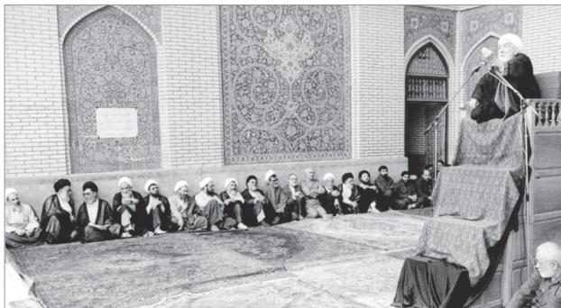
تصویر سخنرانی حجت‌الاسلام فلسفی (وفات: ۲۷ آذر ۱۳۷۷) در مراسم دعا برای سلامتی امام خمینی (ره) در مسجد امام بازر که از سوی آیت‌الله خامنه‌ای رئیس‌جمهور وقت برگزار شد

س: برادران اهل سنت در ایام حج یا غیر آن، نماز مغرب را قبل از اذان مغرب می‌خوانند، آیا برای ما اقتدا به آنان و اکتفا به آن نماز صحیح است؟ ج: معلوم نیست که آنان نماز را قبل از وقت بخوانند، ولی اگر مکلف دخول وقت را احراز نکند، نمی‌تواند داخل شود، مگر آنکه رعایت وحدت آن را اقتضا کند که در این صورت شرکت در نماز جماعت آنان و اکتفا به آن اشکال ندارد. ●