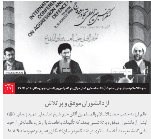
حجت الاسلام عمید زنجانی، حضرت آیت‌الله خامنه‌ای و کمال خرازی در کنفرانس بین‌المللی تجاوز و دفاع - ۱۷ مرداد ۶۷

طوری به ما نمی‌دهد. آنها روی مقاصد خودشان اگر بخواهند کمک بکنند، کمک به خودشان هست؛ نه کمک به ما. و باید ما این عار را از کشور خودمان بزداییم. ● امام خمینی (علیه السلام)؛ ۶ آبان ۱۳۵۸