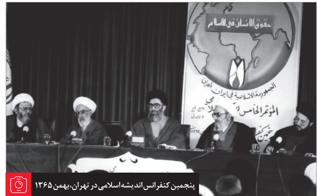
پنجمین کنفرانس اندیشه اسلامی در تهران، بهمن ۱۳۶۵

○ مسافری که می خواهد ده روز یا بیشتر در محلی بماند، اگر از ابتدا قصد داشته باشد که در خلال ده روز به اطراف آنجا (در محدوده‌ی باغها و مزرعه‌های محل اقامت) برود، اشکالی ندارد و قصد اقامه‌ی او درست و نمازش تمام است. همچنین قصد خروج از محل اقامت، به اندازه‌ی کمتر از مسافت شرعی اگر به صدق اقامه‌ی ده روز ضرر نزند یعنی اگر بیرون رفتن از آنجا به مدت چند ساعت از روز یا شب برای یک بار یا چند بار باشد به شرطی که مجموع ساعات خروج از شش هفت ساعت بیشتر نشود، در این صورت، قصد خروج به قصد اقامه لطمه نمی زند و نمازش تمام است؛ اما بیشتر از این، مانع تحقق اقامه است و نمازش شکسته خواهد بود. ●