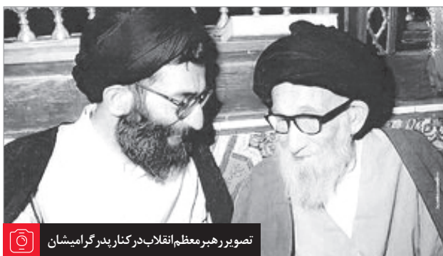
تصویر رهبر معظم انقلاب در کنار پدر گرامیشان

ندارد، هر راهی که برود هیچ آخر ندارد و راهها همه غلط، همه اشتباه، همه منتهی به جهنم می‌شود الا صراط مستقیم؛ آنی که راه انسان است. اگر راهمان بدهند در این «ضیافه الهه» و مستعد شده باشیم که وارد بشویم در این ضیافت خدا و در این ماه مبارک، امید است که ان شاء الله یک هدایتی شامل حالمان بشود.