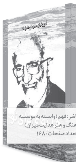
ناشر: فهم (وابسته به مؤسسه فرهنگ و هنر هدایت میزان) تعداد صفحات: ۱۶۸

کتاب «هدیه‌ای برای تو» معرفی استاد فقید، سید هادی محدث است که عمر بابرکت خود را در راه آموزش و ترویج مفاهیم قرآن صرف کرد و در این راه کتاب‌هایی ارزشمند تألیف و شاگردان گرانقدر بسیاری تربیت نمود. این اثر پنجمین مجلد از مجموعه کتاب‌های «آموزگاران مدرسه عشق» است که با همت مؤسسه فرهنگی و آموزشی هدایت میزان و با قلم خانم مریم شریف رضویان به رشته تحریر درآمده است. کتاب «هدیه‌ای برای تو» به تقریر رهبر معظم انقلاب مزین است. در متن این تقریر آمده است: سلام و رحمت خدا بر بنده‌ی صالح خداوند مرحوم آقای سید هادی محدث رحمه الله علیه که معلمی انقلابی و متعهد و پرکار و بااستقامت و بسیار نجیب بود. سایه روشن زیبایی که این کتاب از ایشان ترسیم کرده، هنر مندانه و در خور تحسین است. جا دارد این قبیل چهره‌های نورانی امایی‌های هووی تظاهر، به مردم و جوانان معرفی شوند، یکی از آنها هم آقای محمدی دوست خودمان است. رحمت خدا بر آنان و بر ما. ۹۴/۱۲۵