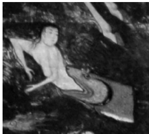
(تصویر ۶) بخشی از تصویر (۱)

احتمالاً این دیو دهشتناک را می‌توان نمایی از زندگی دنیوی نیز تصور کرد که نگارگر وی را به رنگ نارنجی و با وسایل زینتی همچون گردنبند، بازوبند، دستبند و خلخال طلایی ترسیم کرده است. این موجود خیالی با زنگوله‌ای بزرگ بر گردن و زنگوله‌های کوچک آویزان از شاخ‌هایش احتمالاً مردم را به ضلالت می‌کشاند. در بخشی دیگری از نگاره، موجودی افسانه‌ای که زن و مردی بر آن سوارند و درحالی‌که بقیه در حال فرار از دست دیو هستند آنها شادی‌کنان به سمت وی می‌روند (احتمالاً دیو که نمودی از دنیا است برخی مردم بدون دانستن خطری که از جانب وی آنها را تهدید می‌کند، با رغبت به سمت آن می‌روند) نقوش روی لباس دیو نیز از موجودات افسانه‌ای رایج در دوره صفویه تبعیت می‌کند (تصویر ۵).