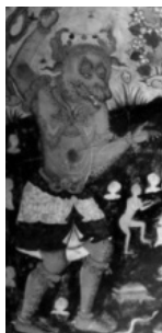
(تصویر ۳) بخشی از تصویر (۱)

اثر، حضور یکی از اولیای الهی را در حال کمک به مردم سراسیمه و پراکنده در دریا نشان می‌دهد که چهره‌اش با پوششی سفید و هاله‌ای نورانی احاطه شده و درحالی‌که نیزه را به شکم دیو بزرگ و نارنجی‌رنگ با چهره‌ای خشن فرو کرده، مشاهده می‌شود. شدت خشم این موجود دهشتناک نیز با شعله‌های منشعب از چشمان و دهانش نمایش داده شده است. بر اساس دعای توسل دیگر، احتمال دارد نجات‌دهنده افراد غریق در دریا، امام هشتم (ع) باشد. آنچه در ابتدا توجه بیننده را به خود جلب می‌کند و قابلیت تفسیر دارد، نوع گزینش رنگ‌های موجود در نگاره است که نمادی از خصوصیات درونی پیکره‌ها و نشان‌دهنده آگاهی خردمندانه نگارگر نسبت به روان‌شناسی رنگ‌هاست. بنابراین، بعضی رنگ‌ها، نماد صفات زمینی و برخی، صفات روحانی و ملکوتی را نشان می‌دهند. چنانچه لباس امام رضا (ع) با توجه به ایمان و اعتقاد ذاتی‌شان به رنگ روحانی سبز که رنگ ولایت، عصمت و طهارت و در یک کلام «صبغة الله» بوده به نمایش درآمده است. ۱ احتمال دارد دلیل انتخاب رنگ آبی اسب امام (ع) به معنی ایمان صاحب آن باشد زیرا این رنگ در هنر کهن گرا به منزله رنگ الهی و آسمانی و رحمت الهی نیز بیان شده است (آیت‌اللہی، ۱۳۷۷: ۱۶۴) (تصویر ۲).