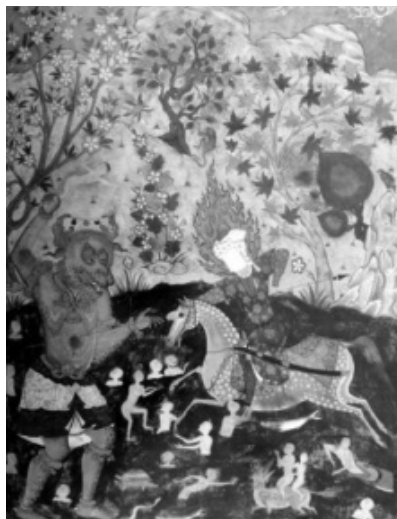
(تصویر ۱) نگاره «نجات مردم در دریا توسط امام رضا(ع)» (Farhad, 2009: 132).

نگاره «نجات مردم در دریا توسط امام رضا(ع)»، با توجه به روش آیکونولوژی به اختصار مورد خوانش قرار می‌گیرد. ۳ این تصویر یکی از بیشمارترین نگاره‌هایی است که موضوع مبارزه میان نیروهای خیر و شر را به نمایش گذاشته است. ۴ (تصویر ۱).