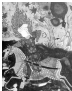
(تصویر ۲) بخشی از تصویر (۱)

درحالی‌که رنگ نارنجی متمایل به قرمز دیو خشمگین، بیان‌کننده حالت تهاجمی، رنگ زمینی و نمادی از وسوسه‌های شیطانی بوده و تقریباً تنها رنگ گرم کل این نگاره است و بایستی