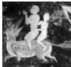
(تصویر ۵) بخشی از تصویر (۱)

اگرچه در اینجا صحنه‌ای مانند مضمون «یونس (۴) در شکم ماهی» مشاهده می‌شود که طبق آیه «وَذَا النُّونِ إِذْ ذَهَبَ...» در گرفتاری و ظلمات بایستی به پروردگار پناه برد تا از مشکلات رها شد، ولی هنرمند با تأکید بر استمداد از امام رضا (۵) در مقابله با دیو، موضوع «توسل» را به نمایش گذاشته تا بدین نکته اشاره کند که نقش توسل در دنیا غیر قابل انکار است و انسان به‌وسیله آن بایستی به خداوند نزدیک شده و حوائج مادی و معنوی خود را طلب کند (تصویر ۶).