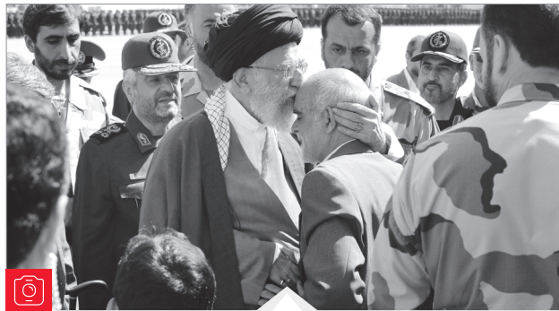
دیدار احمد احمد با رهبر انقلاب در دانشگاه امام حسین (ع)

سلام؛ لطفاً نسخه تابلو اعلانات رو هم با نسخه‌های مطالعه و چاپی آماده کنید و برای دانلود تو همون صبح روز پنجشنبه رو سایت قرار بدین چون ابعادش بزرگه برای چاپش با مشکل مواجه میشیم! پاسخ: تشکر از تذکر شما. نسخه تابلو اعلانات پس از تکمیل نهایی نسخه اصلی، با طراحي می‌شود. که این امر کمی زمانبر است. ●