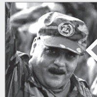
این شماره تقدیم می شود به روح پرفتوح آزاده شهید سمیر قنطار

حضرت آیت... خامنه ای در تاریخ ۸۷/۱۱/۱۳ در دیدار جمعی از زندانیان آزاد شده از بند رژیم های مستبد که در آن دیدار شهید سمیر قنطار نیز حضور داشت فرمودند: شما با مجاهدت و صبر خود در زندان، نهضت عظیم و جهانی بیداری اسلامی را گام هایی به پیش بردید. ضمن آن که هر لحظه از مقاومت شما نزد خداوند مأجور و دارای حسنه است.