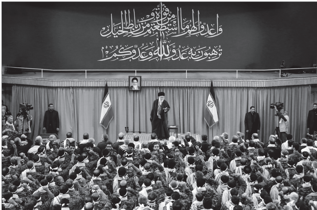
گزارشی از تغییر و تبدیل در «نظم مستقر حاکم قبلی دنیا»