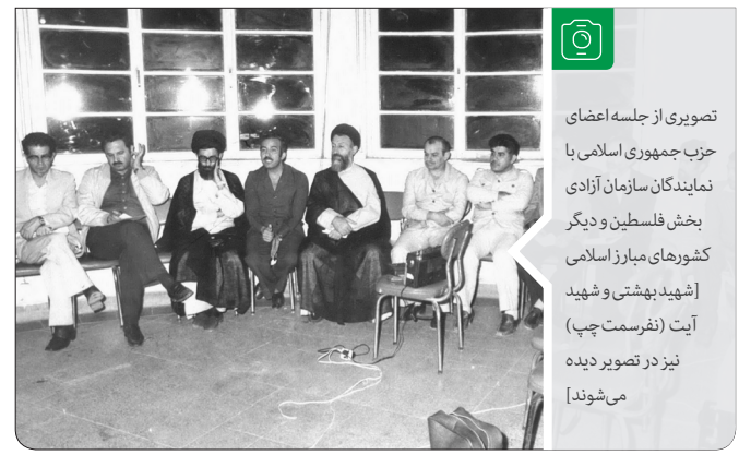
تصویری از جلسه اعضای حزب جمهوری اسلامی با نمایندگان سازمان آزادی بخش فلسطین و دیگر کشورهای مبارز اسلامی [شهید بهشتی و شهید آیت (نفرسمت چپ) نیز در تصویر دیده می‌شوند]