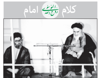
کلام روح الامم