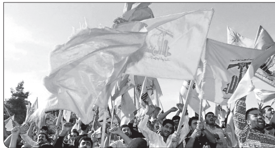
نشده، بلکه آنچنان قوی و مقتدر شد که توانست ارتش اسرائیل را که به صورت افسانه‌های شکست‌ناپذیر میدانستند، شکست بدهد. ● ۸۶/۱۰/۲۳